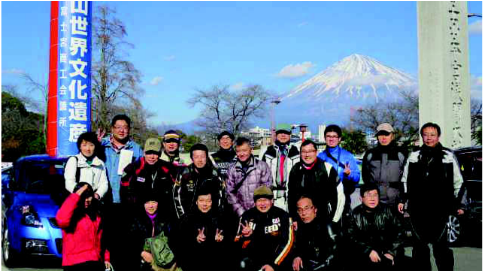
浅間大社での記念写真、富士山がバッチリ