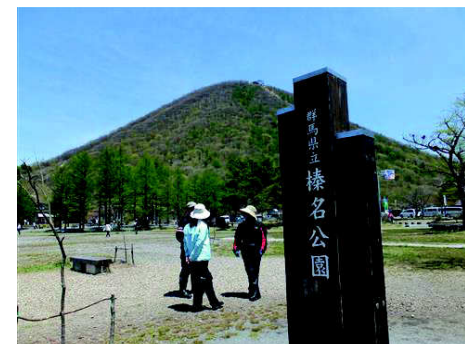
空が透きとおっています