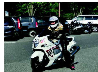
ツカさん 白フサが五月晴れに映えます。 狙った獲物は逃しません!