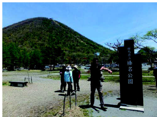
この高さでも少し汗ばむくらいでした☀