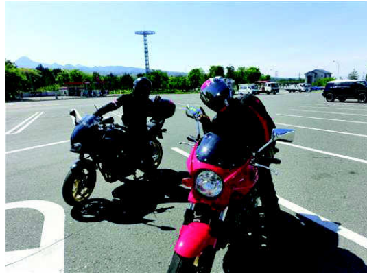
いつも仲良しです♪