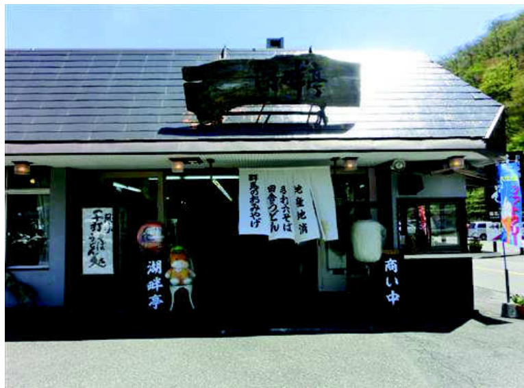
ぐんまちゃんもお出迎え

NewForest+歓迎ということで、湖畔亭から ワカサギ天ぷらと温泉まんじゅうをサービス ♪ ごちそうさまでした！