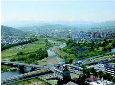
上毛三山から浅間まで眺められました。