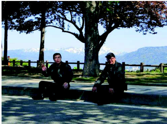
谷川をバックに、ナイスミドル！