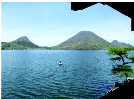
榛名湖を眺めながらの昼食⇔⇔