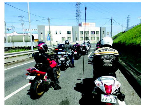
さすが、NewForest、編隊バッチリ!

■高崎市役所に到着です。 今回のテーマ“たかいところ”その2です。展望ロビー21Fは高さ102.5メートル ☺