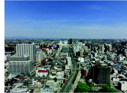
高崎市街地から前橋・伊勢崎までクリアでした。