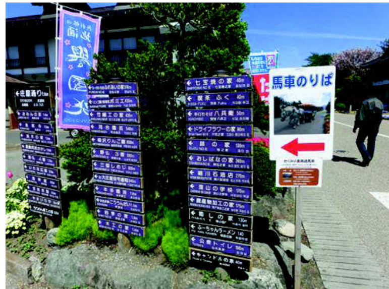
誰ですか？ シャッターを叩いて開店させたのは！？