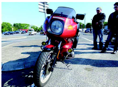
MORINOさん 後付けフォグも昭和の漂いが 特別色も似合います。