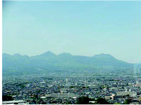
今年は上州の眠い姫と会えました!