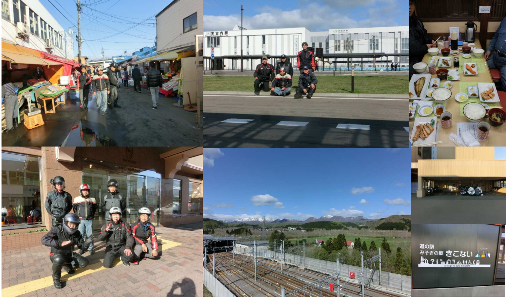
函館の朝食は朝市で、木古内で北海道新幹線の北海道側トンネル出入り口を見学