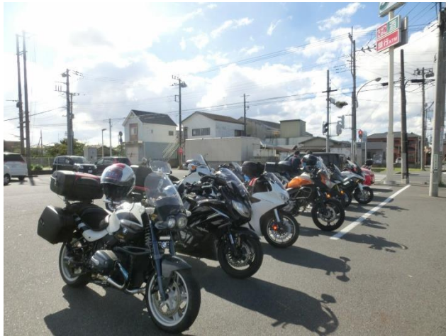
豊岡海岸付近で臨時の休憩タイム