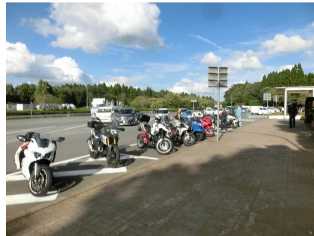
千葉東金道路野呂PAで最後の休憩