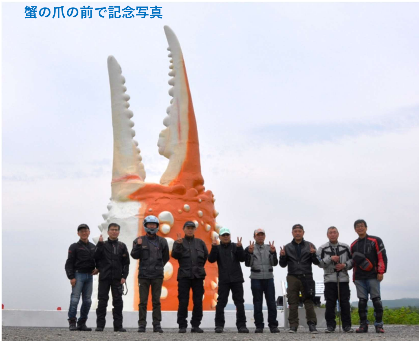
蟹の爪の前で記念写真