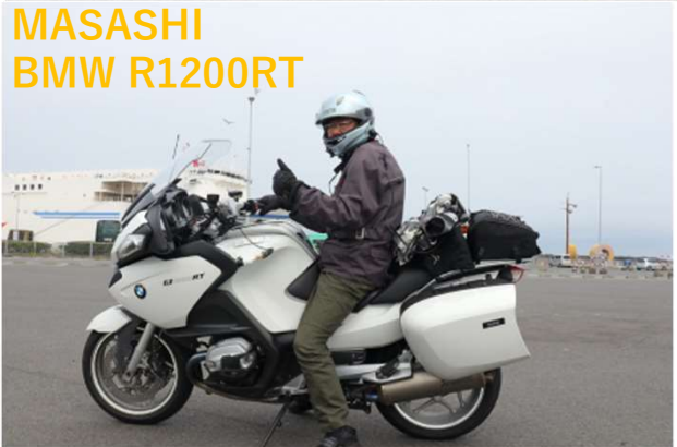
MASASHI BMW R1200RT