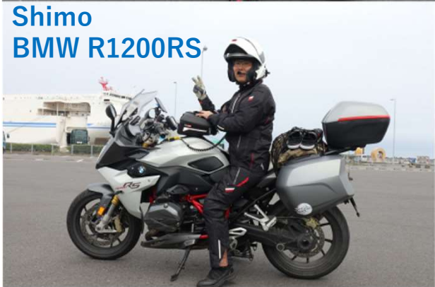
Shimo BMW R1200RS