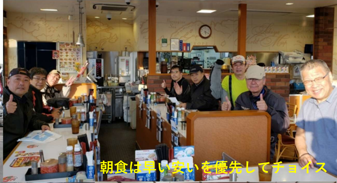
朝食は早い安いを優先してチョイス