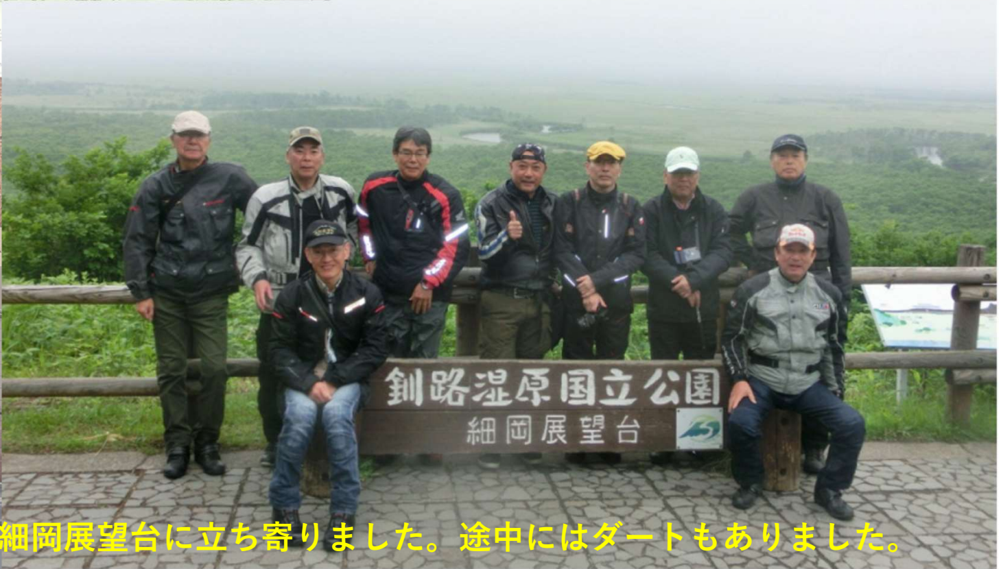
ホテルを出発し、釧路湿原を見渡せる細岡展望台に立ち寄りました。途中にはダートもありました。