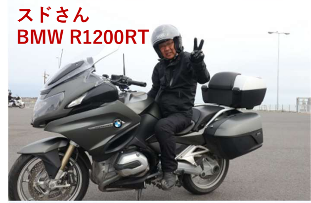
スドさん BMW R1200RT