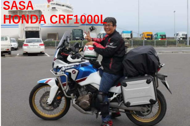
SASA HONDA CRF1000L