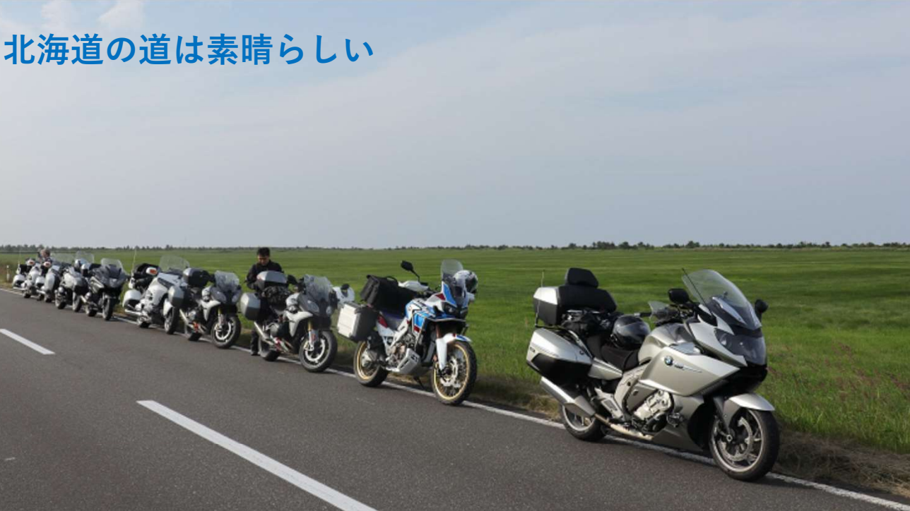
北海道の道は素晴らしい