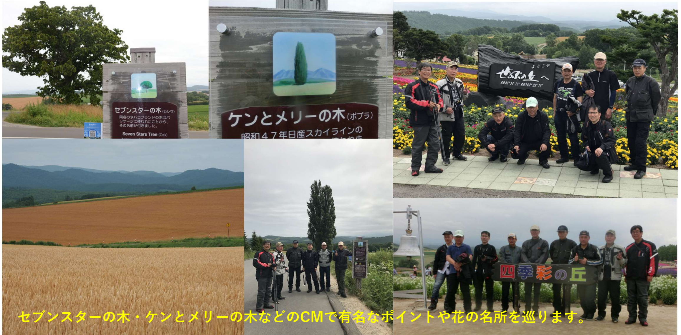
セブンスターの木・ケンとメリーの木などのCMで有名なポイントや花の名所を巡ります。