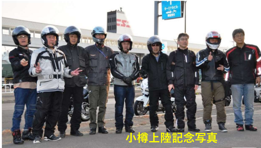
小樽上陸記念写真