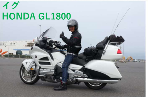
イグ HONDA GL1800