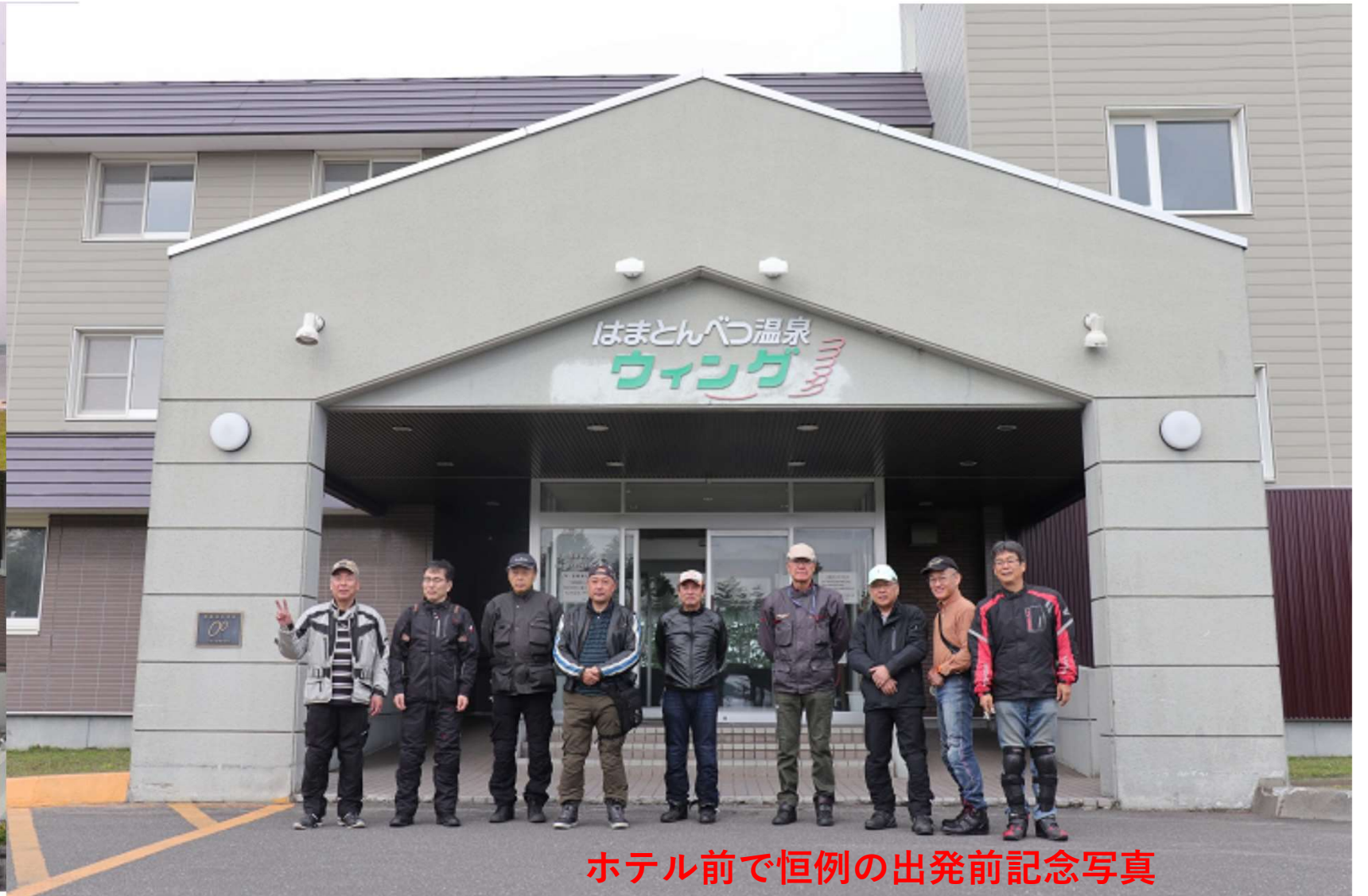
ホテル前で恒例の出発前記念写真