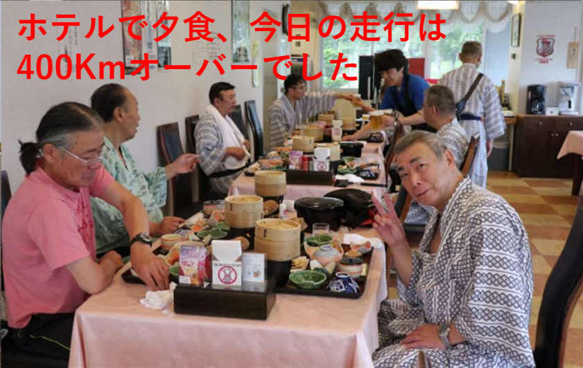
ホテルで夕食、今日の走行は400Kmオーバーでした