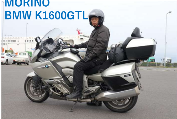
MORINO BMW K1600GTL