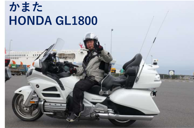
かまた HONDA GL1800