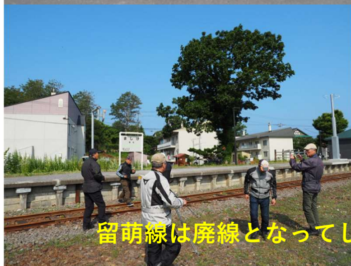
留萌線は廃線となってしまいましたが、駅舎がリニューアルされて残る増毛駅で小休止