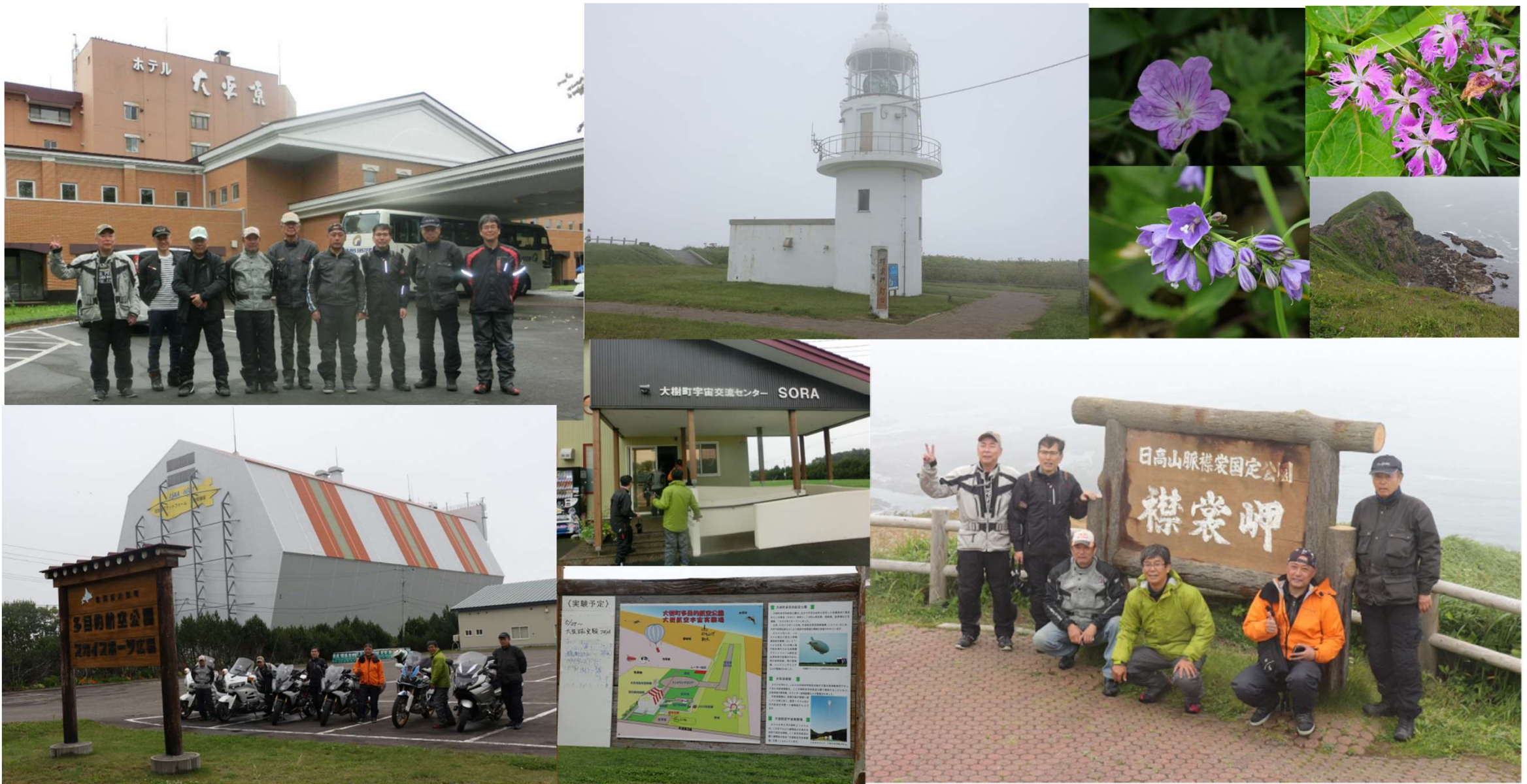
ホリエモンロケットの発射地として有名な大樹町SORAを外から見学、襟裳岬に寄って苫小牧を目指します。