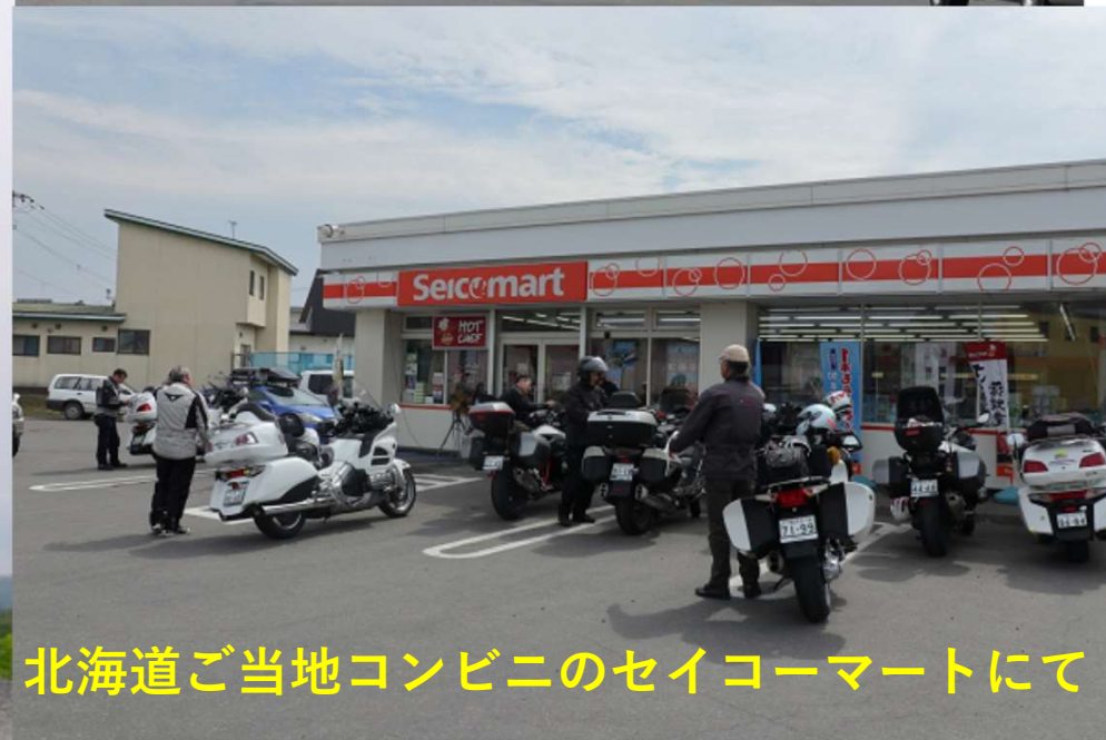
北海道ご当地コンビニのセイコーマートにて