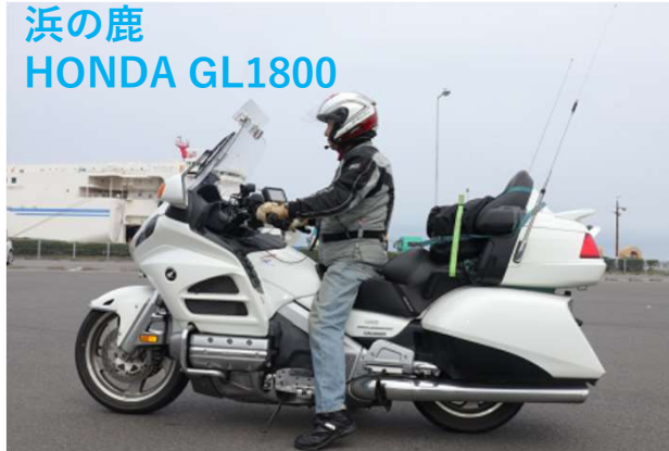
浜の鹿 HONDA GL1800